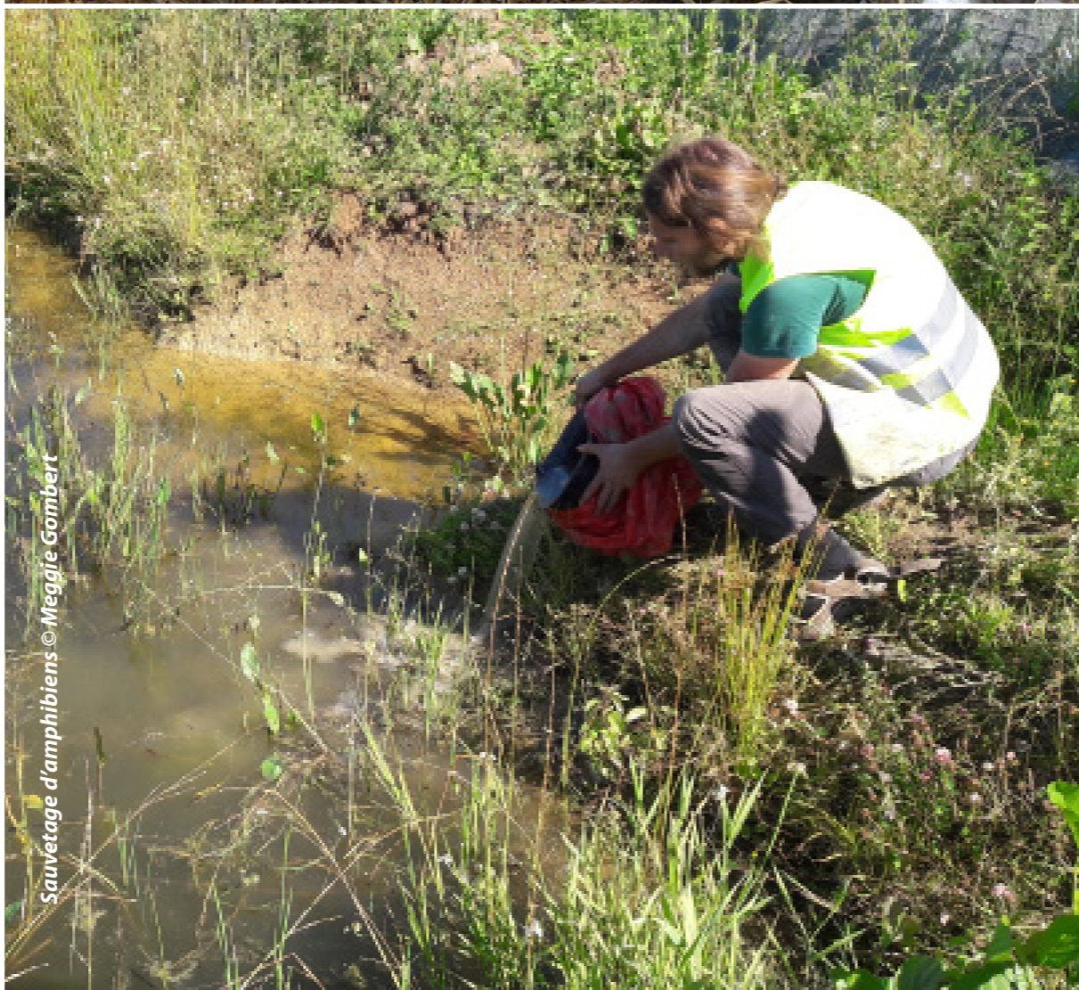
Sauvêtage d'amphibiens