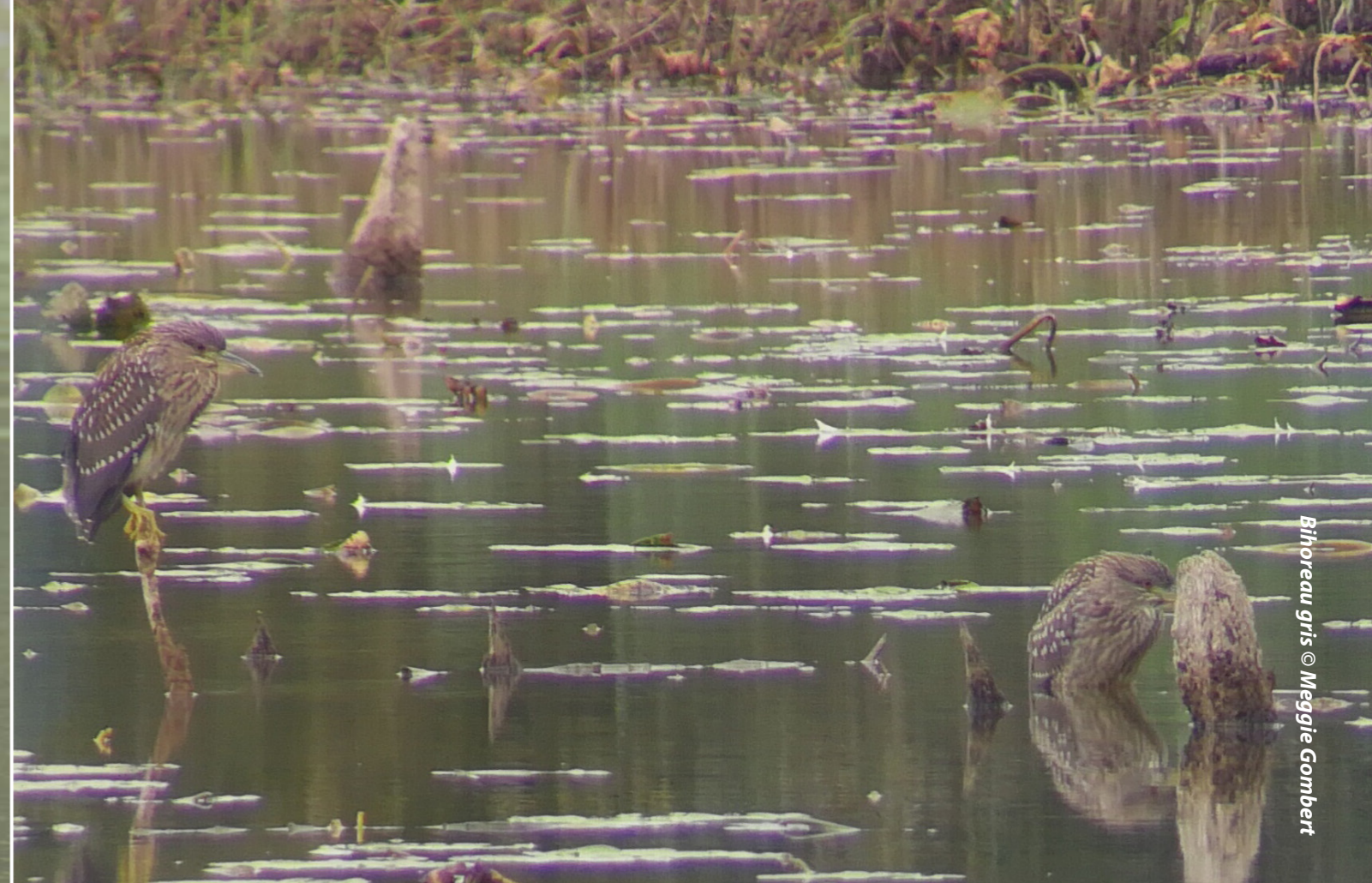
Bihoreau gris