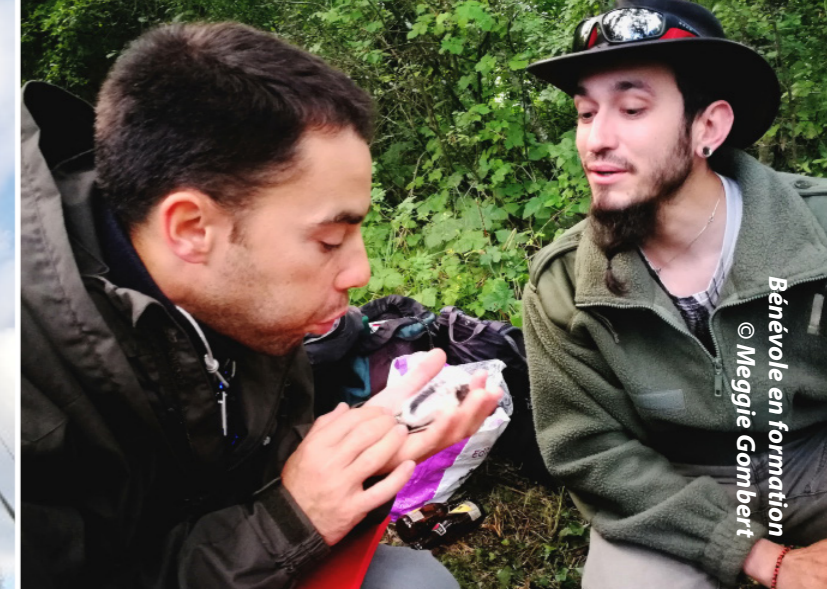
Bénévole en formation