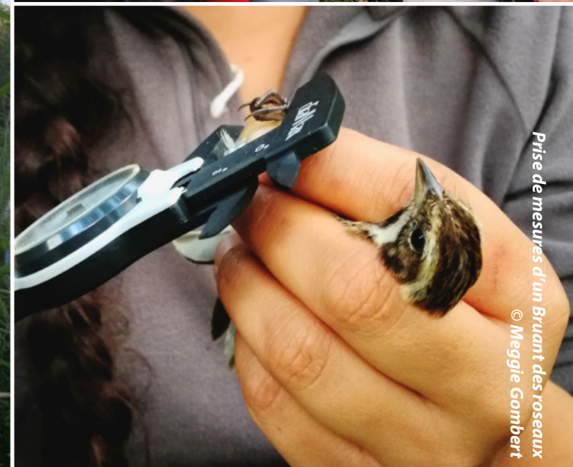
Prise de mesures d'un Bruant des roseaux