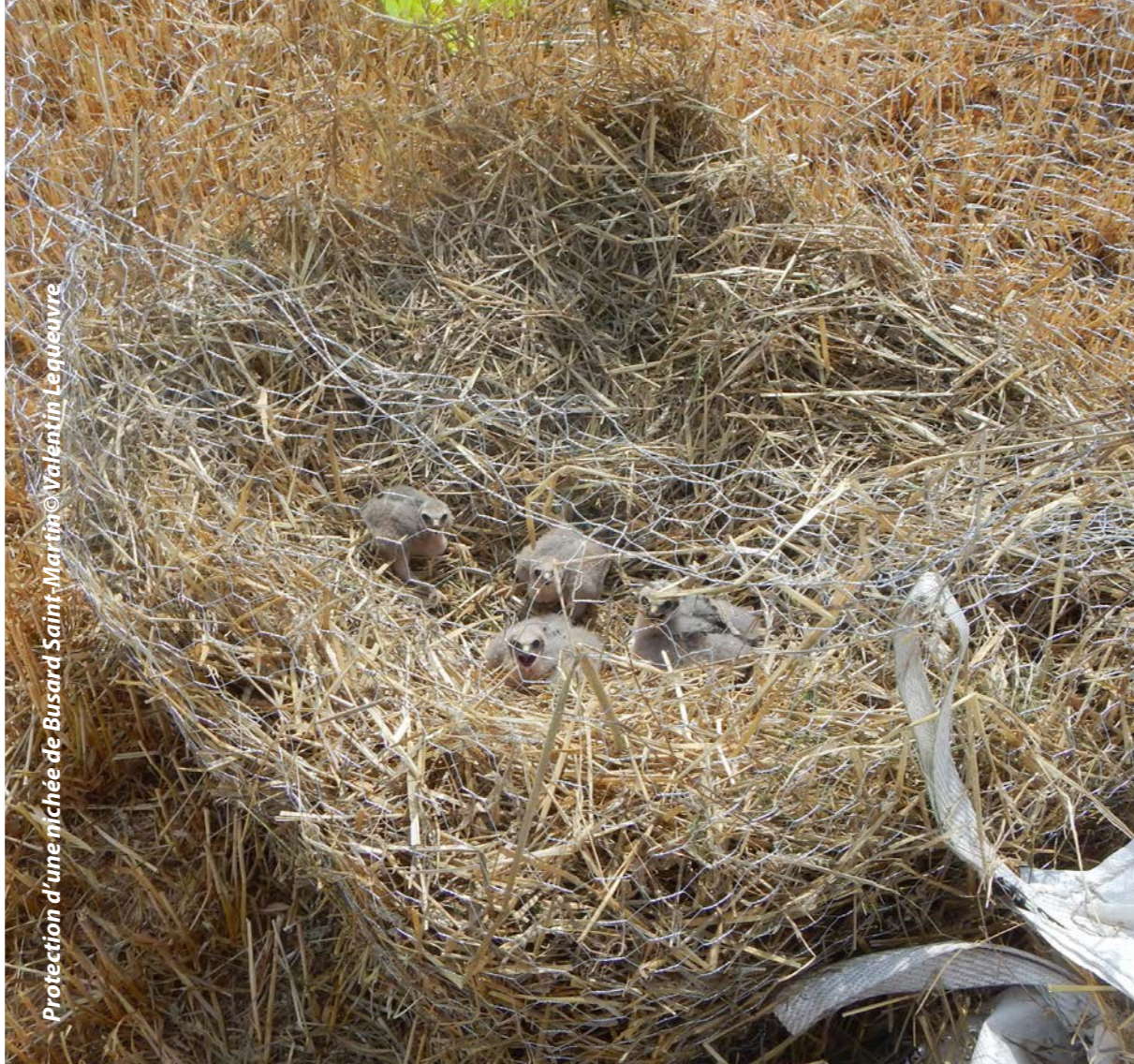
Protection d'une nichée de Busard Saint-Martin

En vu d'un projet de parc éolien dans le secteur de Wignicourt, le CPIE du Pays de Soulaines nous a missionnés pour réaliser 4 passages durant les mois de juin et juillet afin de rechercher la Cigogne noire. Aucune observation de l'échassier mais des échanges avec les locaux nous ont confirmé la présence de l'oiseau au bord des cours d'eau de la zone d'étude.