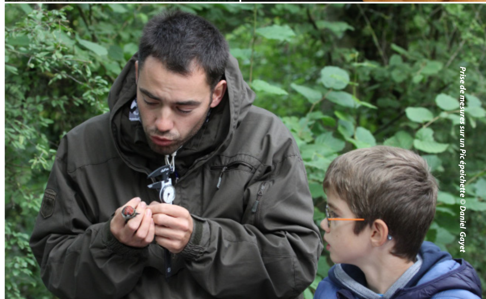
Prise de mesures sur un Pic épeichette