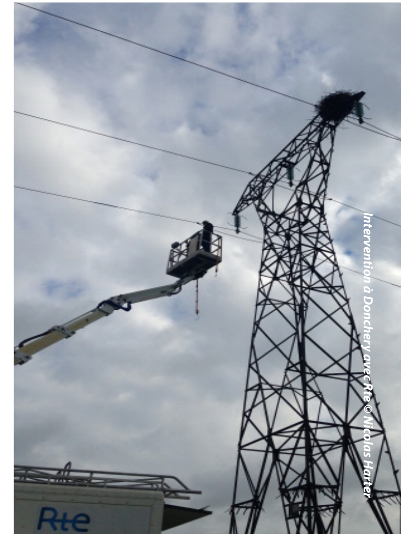
Intervention à Donchery avec Rte

PNR des Ardennes ont également eu lieu cette année pour la gestion durable et la restauration de zone humide sur des parcelles forestières récemment acquises par la commune d'Arreux, ainsi que pour la gestion des tourbières du massif ardennais. L'ensemble de ces actions ont représenté une cinquantaine d'heures auxquelles il convient de rajouter le temps passé par les bénévoles qui ont appuyé certaines démarches.