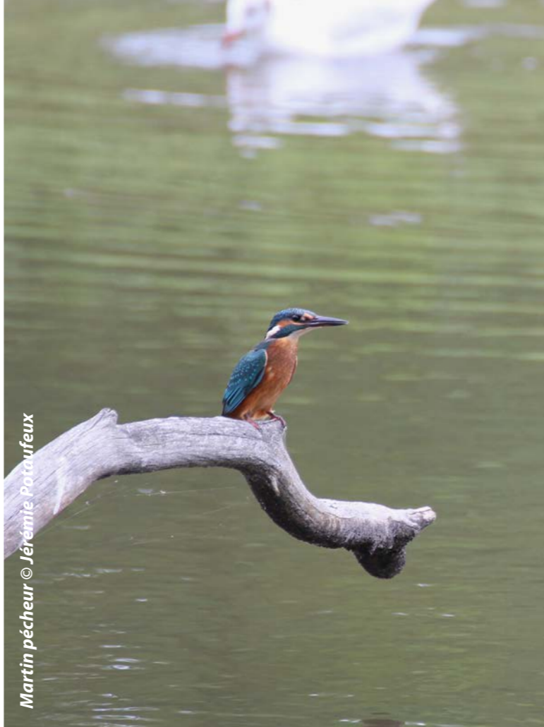
Martin pêcheur

Les adhérents sont les piliers de l'association, sans qui de nombreux projets de protection de la nature ne verraient jamais le jour. C'est pour cela que le ReNArd prend plaisir à se retrouver autour de sorties réservées aux adhérents. Cette année 2017 a été l'occasion de relancer ces événements en septembre. Malgré un temps mitigé, 26 personnes ont répondu présent. La journée a été riche en observations avec un Balbuzard pêcheur, Faucon hobereau, Vanneau huppé, Martin-pêcheur d'Europe, Chevalier guignette, Bécasseau variable, Grand gravelot, Chevalier aboyeur, Bécasseau cocorli... Muni de jumelles et de longues-vues mises à disposition de tous, chacun a pu découvrir la richesse de Bairon dans un esprit de partage de connaissance, qu'importe son niveau naturaliste. Pour se remettre de toutes ces émotions, le groupe s'est ensuite retrouvé à 12h. Tour de table afin que chacun se présente et repas tiré du sac à « l'auberge espagnole » pour conclure cette belle journée où les rires et la bonne humeur étaient au rendez-vous ! Au vu de l'enthousiasme général des participants, de nouvelles rencontres verront le jour en 2018. De nombreuses demandes des adhérents nous motivent également à organiser de nouveau des séjours comme dans le Nord-Pas-de-Calais par exemple. (Reportage photo ci-contre)