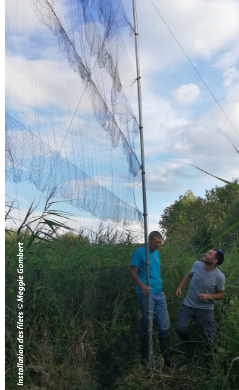
Installation des filets

Au cours de l'année, le ReNard reçoit une centaine d'appels de particuliers ayant trouvé des animaux blessés ou bien s'interrogeant sur le comportement anormal d'un animal. L'association réalise donc un travail de médiation faune sauvage en apportant des conseils et solutions pour venir en aide aux personnes. Qu'il s'agisse d'indiquer le centre de soins le plus proche, de conseiller les découvreurs sur la conduite à tenir lors de la découverte d'un animal en détresse ou de les sensibiliser, le ReNard prend à cœur de répondre chaque appel.