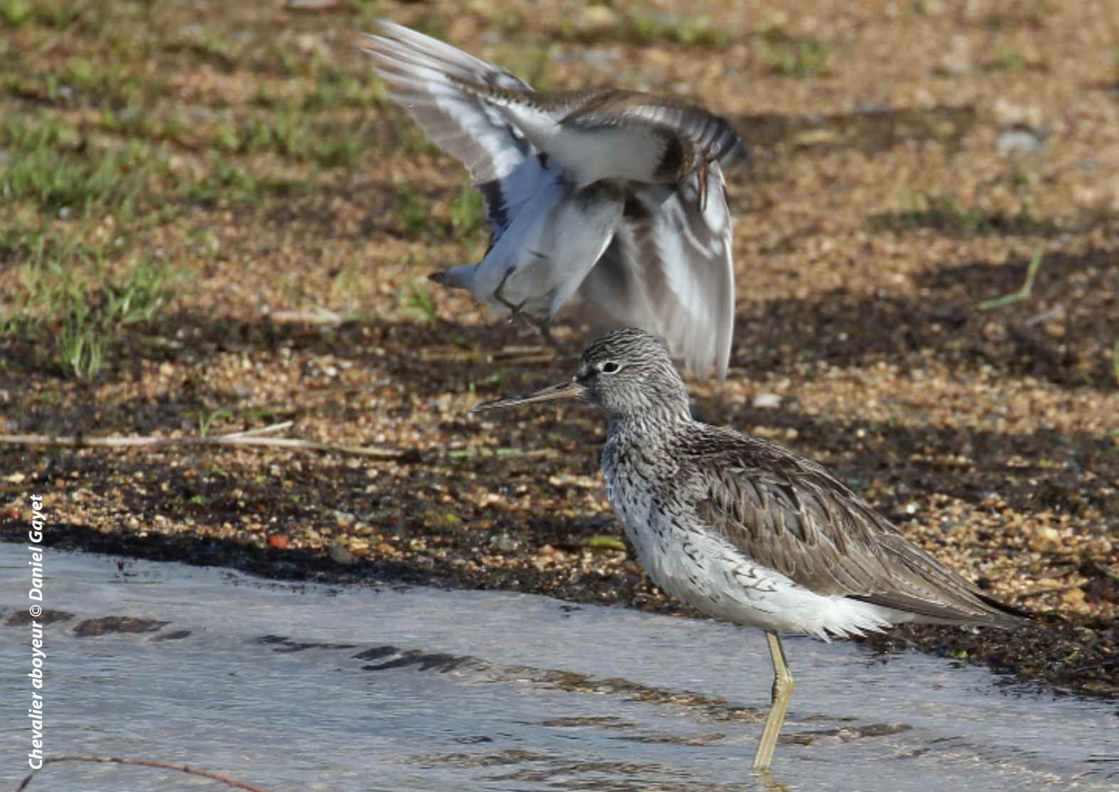
Chevalier aboyeur

Dans le cadre des Nouvelles Activités Périscolaires, l'association est intervenue à 11 reprises dans l'école de Guignicourt-sur-Vence. A chaque séance, l'animateur encadrerait 10 enfants de la classe de primaire sur différentes animations : coloriage et collage de silhouettes de rapaces sur les fenêtres de l'école pour diminuer les risques de collision, découverte du Castor en salle et sur le terrain, apprentissage du cycle de vie d'un arbre et découverte de la mare par les dessins, traces et indices des animaux.