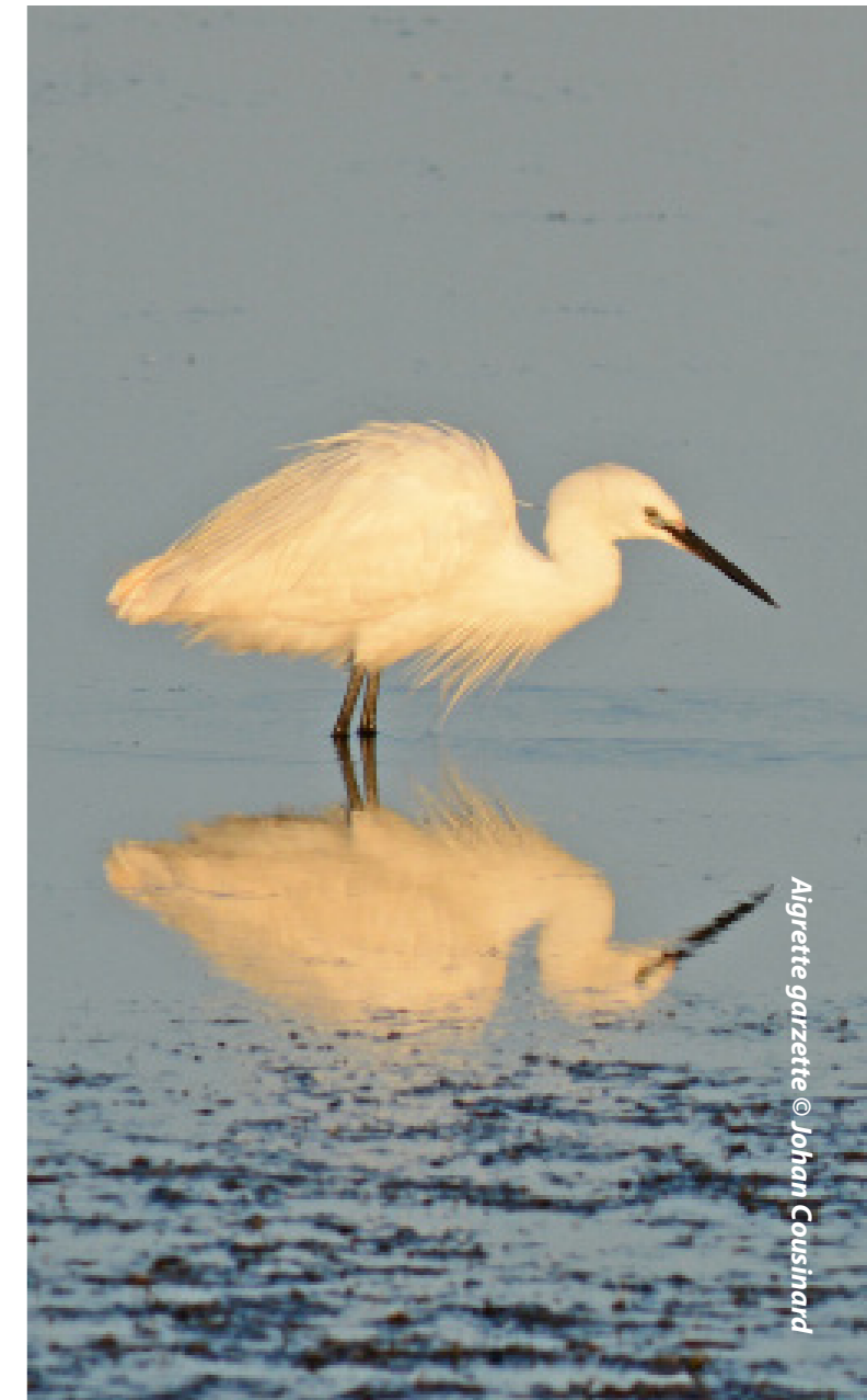
Aigrette garzette

Fait marquant de 2017 : pas assez d'eau et trop de froid. En résumé un WI qui ne restera pas gravé dans les mémoires. En terme d'effectifs seulement 30 espèces ont été observées soit la 5e pire année depuis 1995. Néanmoins on notera une forte mobilisation des bénévoles pour ce comptage, ce qui a permis une très bonne couverture du département. On pourra noter toutefois une petite remontée des canards plongeurs par rapport à 2016, et l'observation pour la troisième fois seulement d'une Aigrette garzette dans la vallée de la Bar. Les laridés ont toutefois défrayé la chronique avec un record historique en dépassant les 360