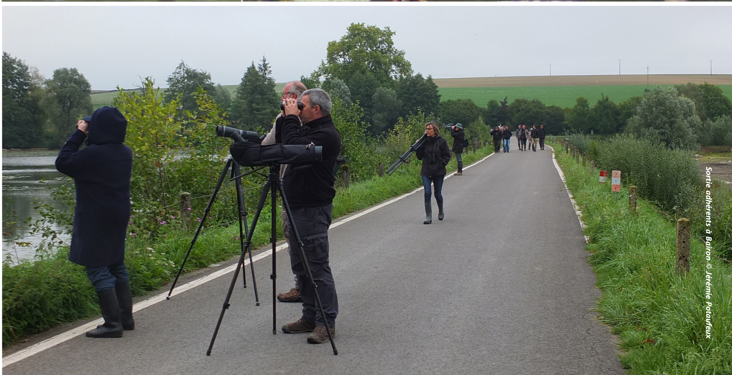
Sortie adhérents à Bairon