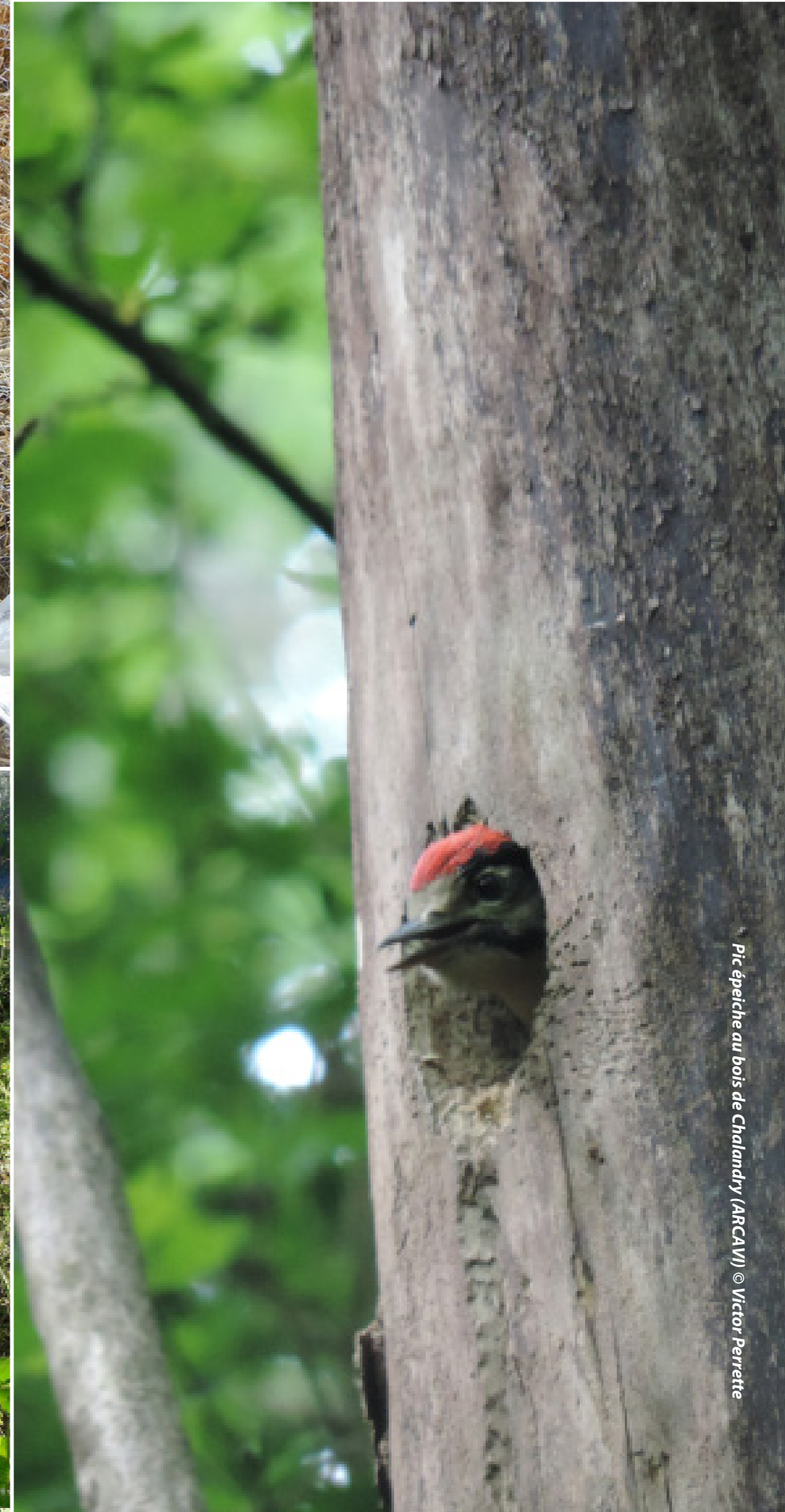
Pic épeiche au bois de Chalandry (ARCAVI)