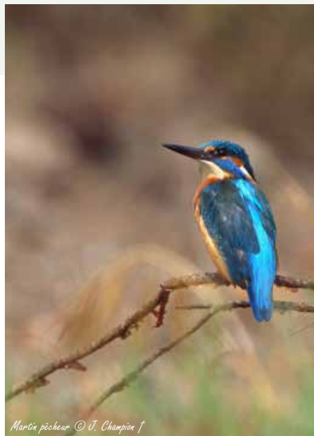
Martin pêcheur