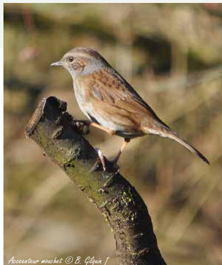
Accenteur mochet © B. Gilquin f