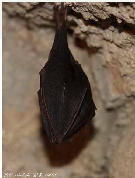
Petit rhinolophe