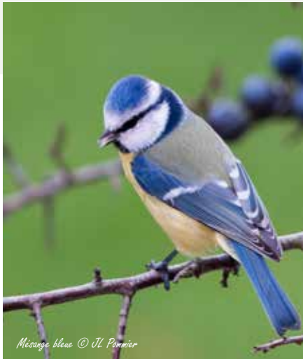
Mésange bleue