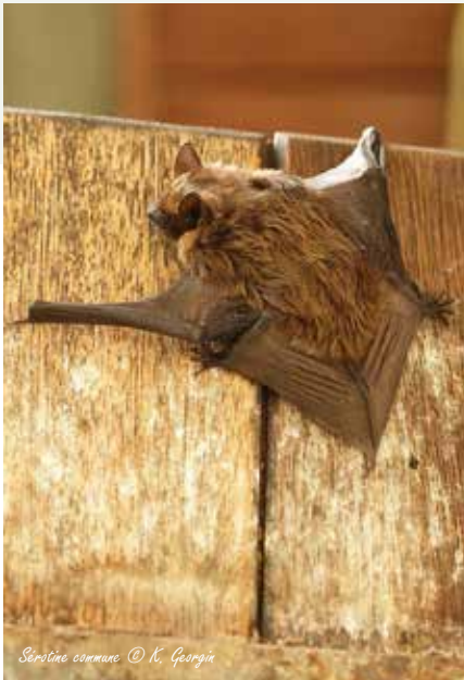
Serotine commune