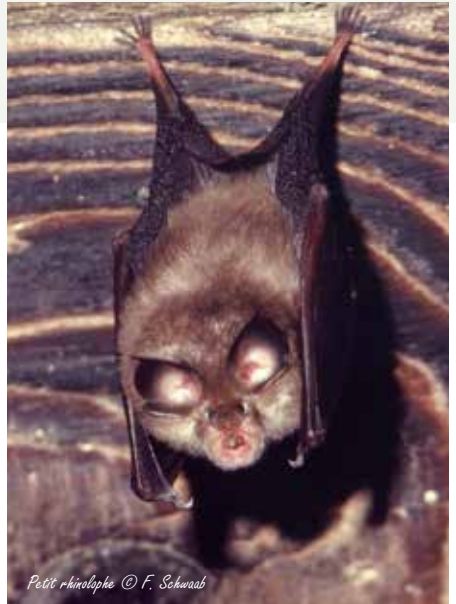
Petit rhinolophe