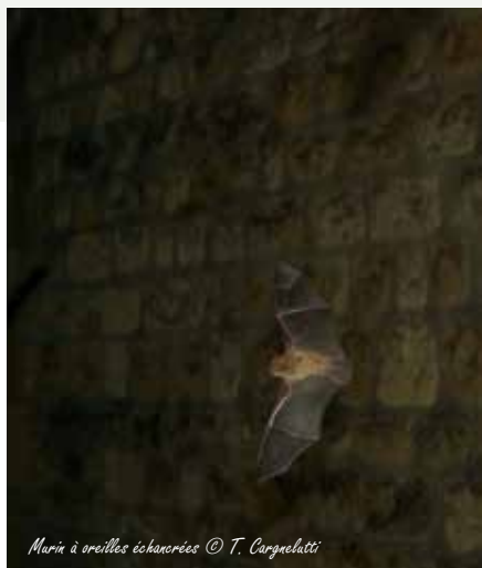
Murin à oreilles échancrées