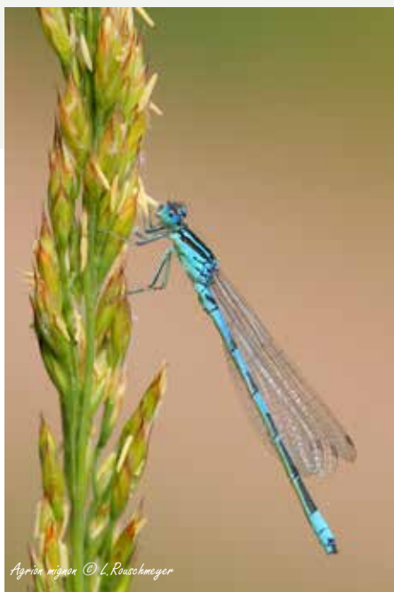
Agrion mignon