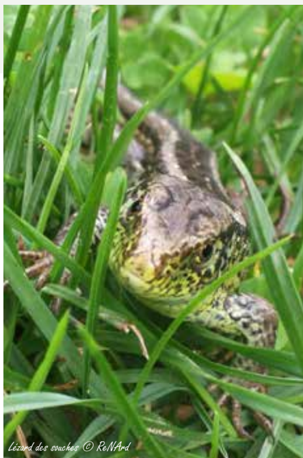
Lézard des souches