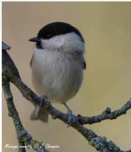
Mésange nonette