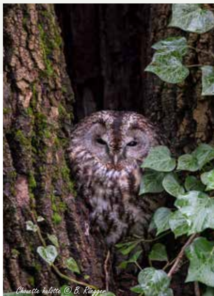
Chouette hulotte