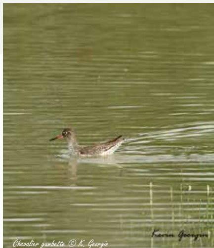
Chevalier gambette