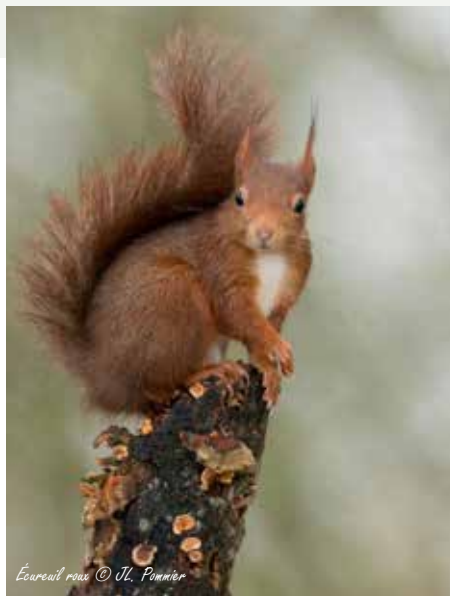
Écureuil roux