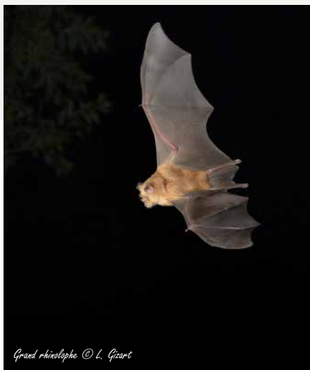
Grand rhinolophe