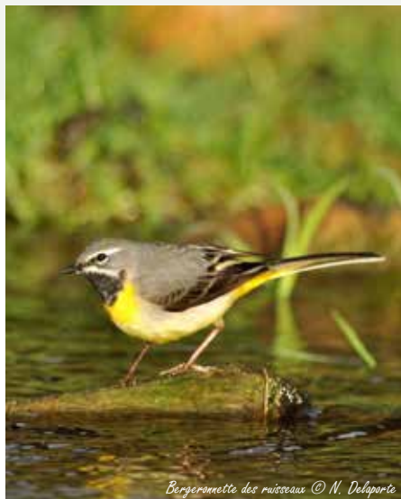
Bergeronnette des ruisseaux