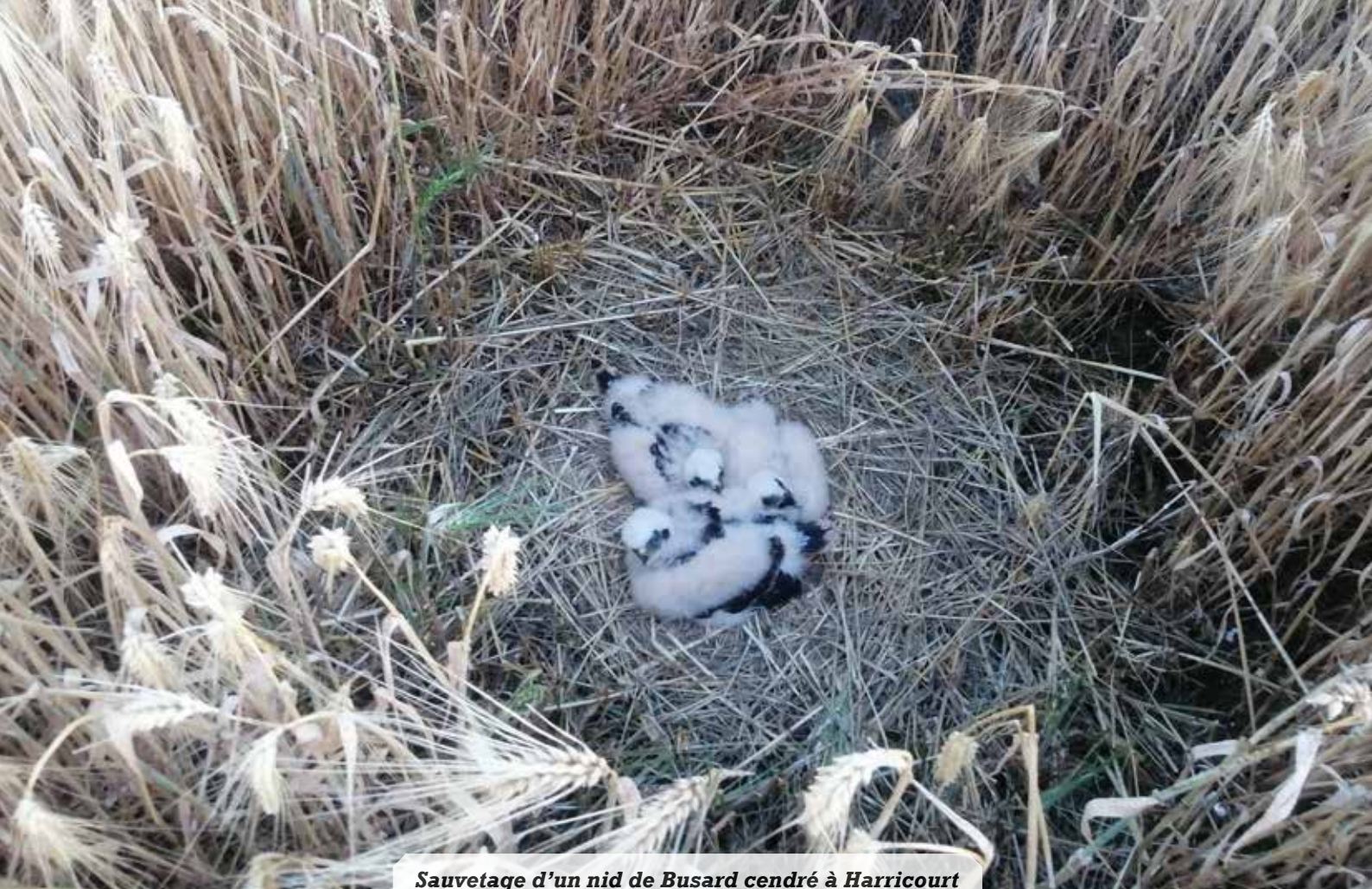
Sauvetage d'un nid de Busard cendré à Harricourt