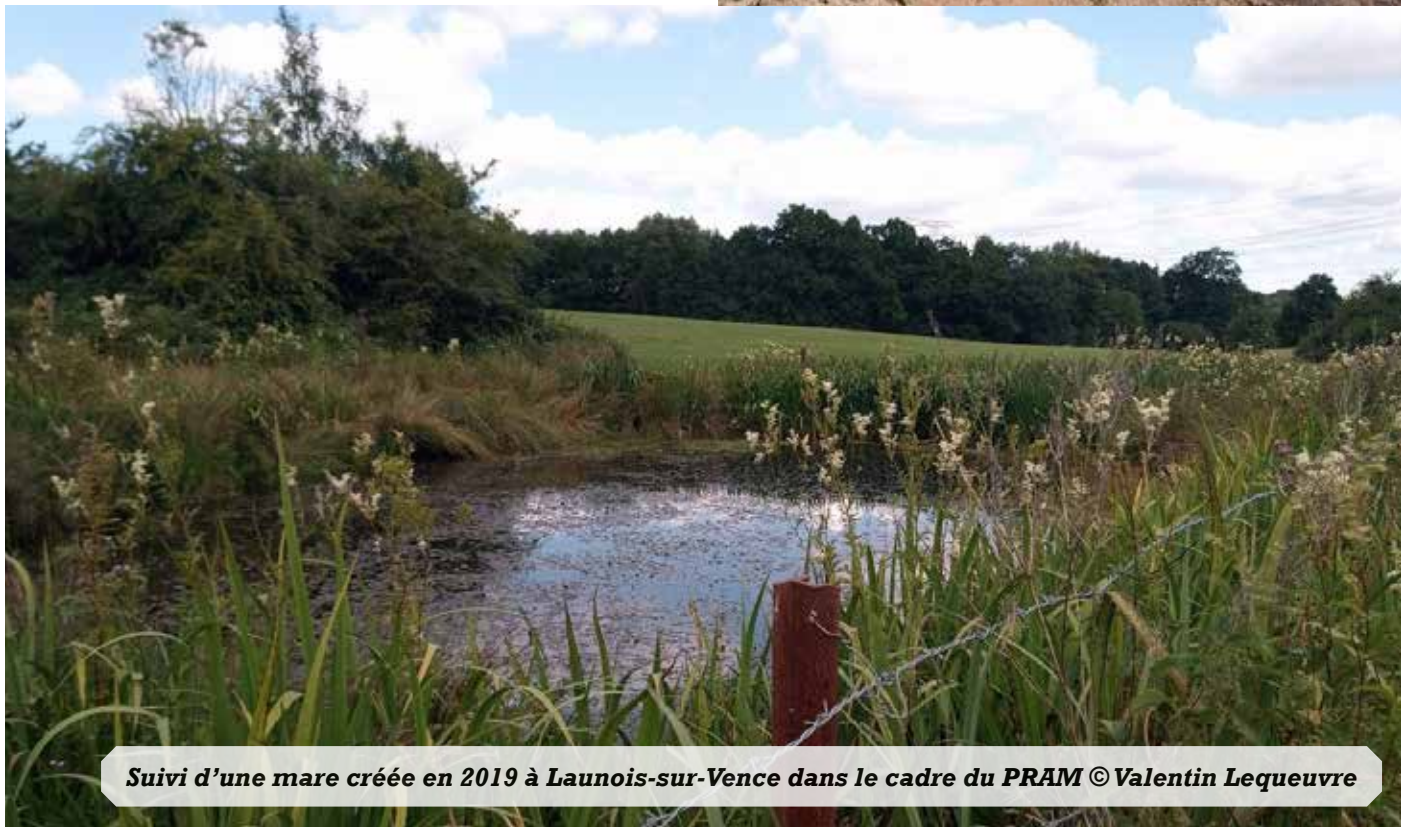
Suivi d'une mare créée en 2019 à Launois-sur-Vence dans le cadre du PRAM