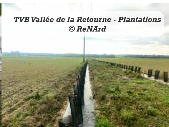
TVB Vallée de la Retourne - Plantations