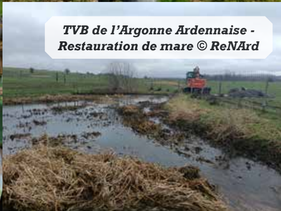
TVB de l'Argonne Ardennaise - Restauration de mare