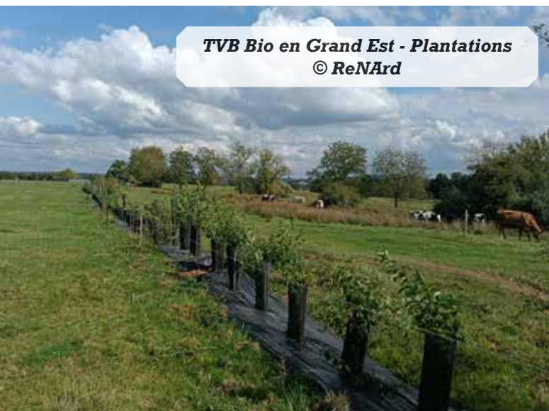
TVB Bio en Grand Est - Plantations

De nouveaux projets verront encore le jour en 2026.