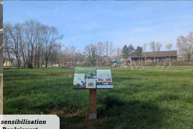
Panneaux de sensibilisation installés à Boulzicourt