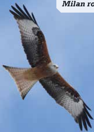
Milan royal

Encore merci à tous les bénévoles qui se sont mobilisés.