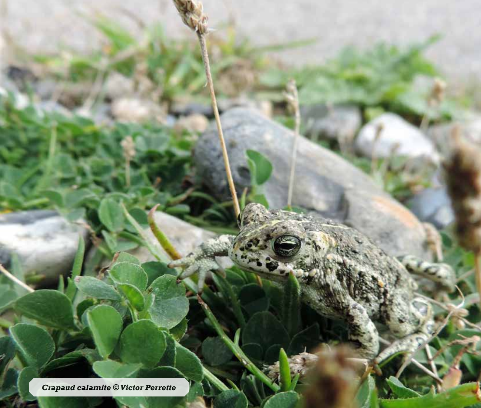
Crapaud calamite