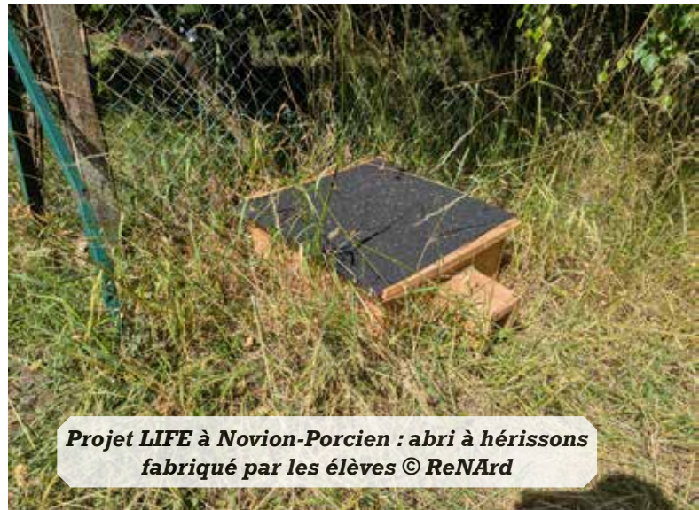
Projet LIFE à Novion-Porcien : abri à hérissons fabriqué par les élèves

Le programme LIFE Biodiv'Est est financé par un groupement de financeurs publics (L'Europe, les trois Agences de l'Eau, la Région Grand Est et l'Office Français de la Biodiversité).