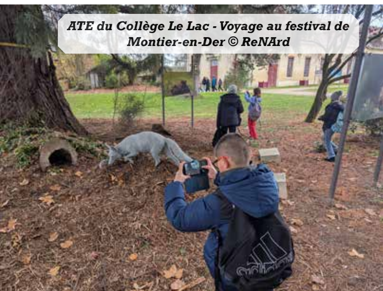
ATE du Collège Le Lac - Voyage au festival de Montier-en-Der

Les ATE sont financées par l'Office Français de la Biodiversité.