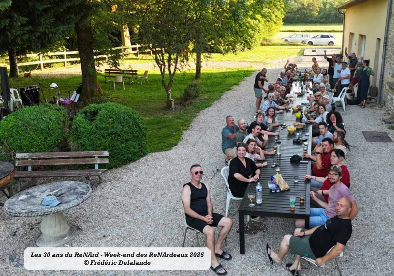
Les 30 ans du ReNard - Week-end des ReNardeaux 2025