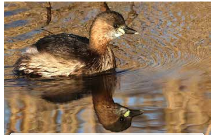
Concours thèmes « oiseaux » et « papillons » Grèbe castagneux Petit Mars changeant

Pour rappel, le groupe photo est ouvert à toutes et à tous que vous participiez ou non aux activités, notamment aux concours.