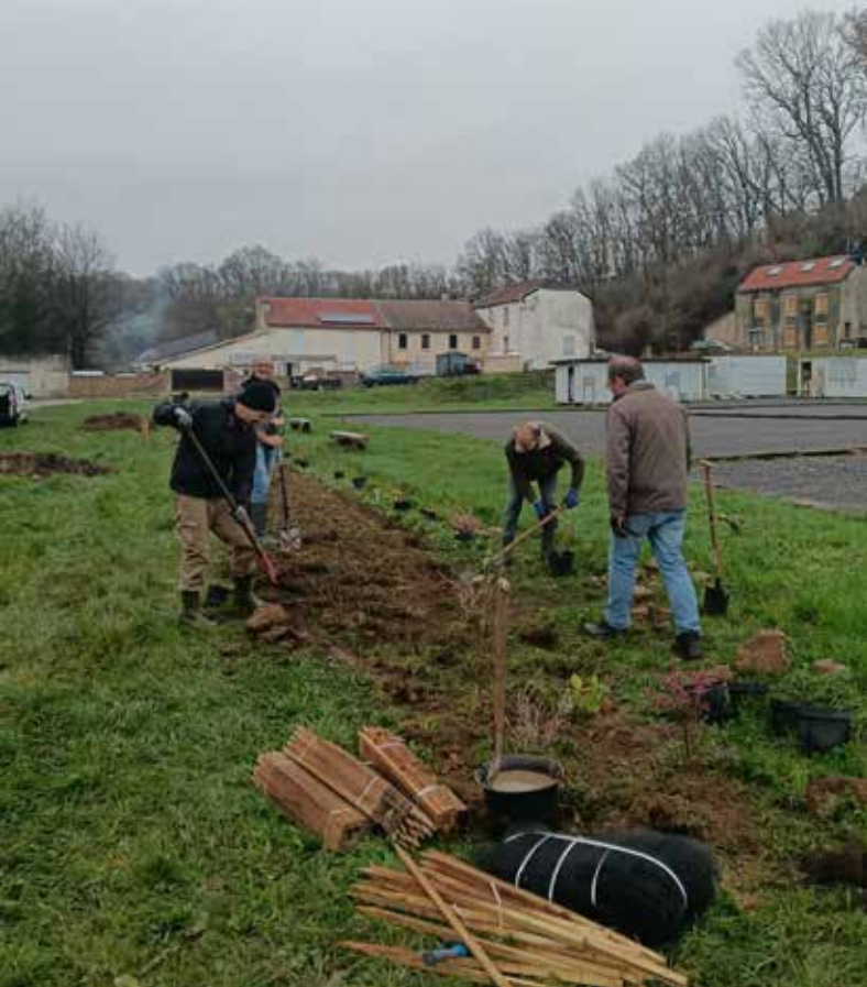
Plantation de haie pour l'ABC de Saint-Menges

Ce programme a été rendu possible grâce au soutien de l'Office Français de la Biodiversité (OFB).