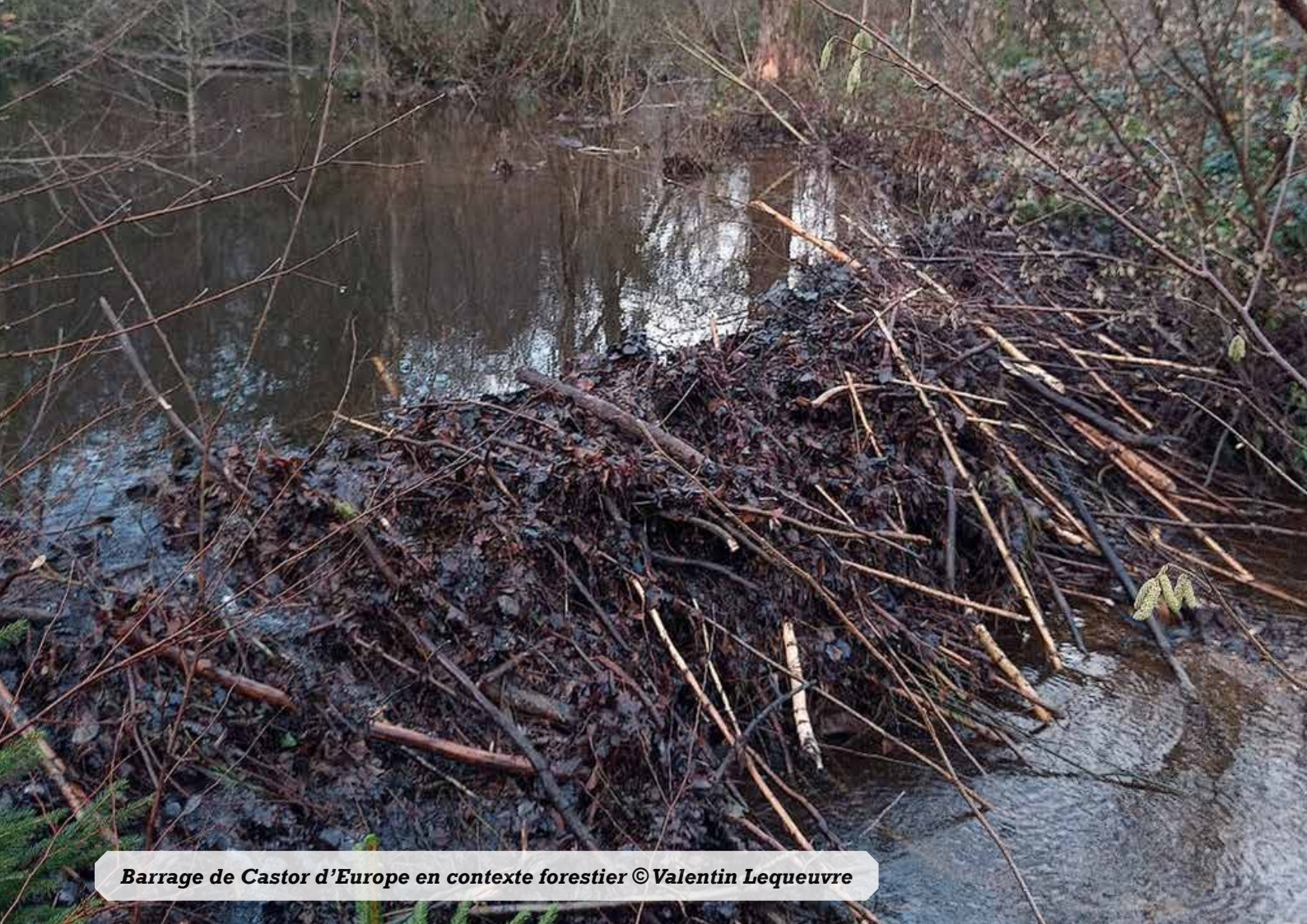
Barrage de Castor d'Europe en contexte forestier