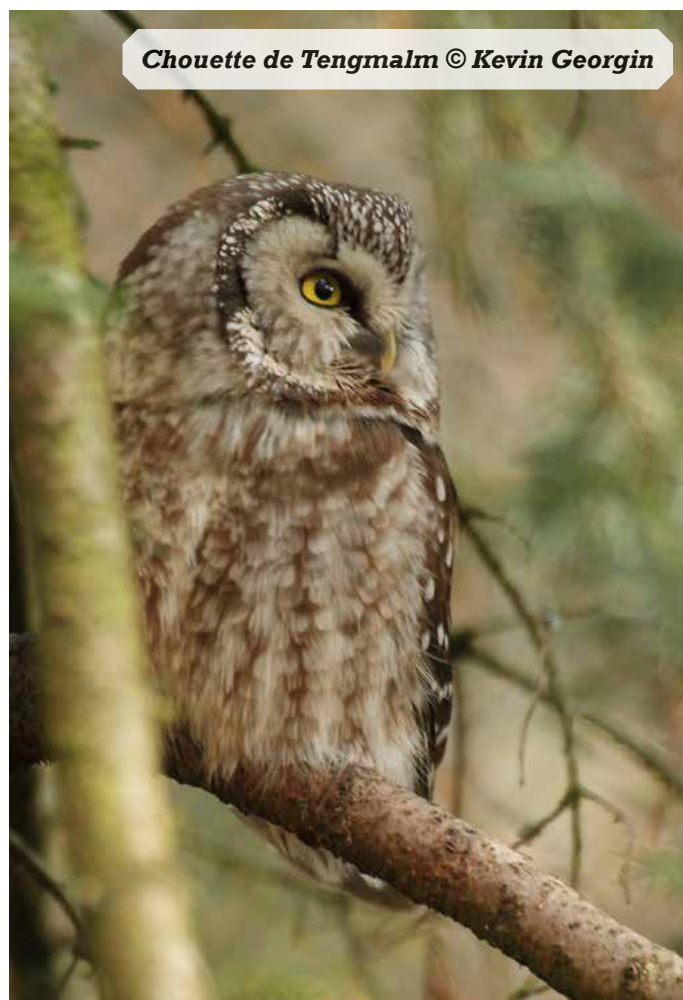
Chouette de Tengmalm

Ainsi, malgré des prospections limitées en 2025 par manque de temps, 3 individus ont pu être entendus. Il s'agissait toutefois de cris d'alarme et non de chants territoriaux, ce qui n'est donc pas suffisant pour parler de nidification probable ou certaine.