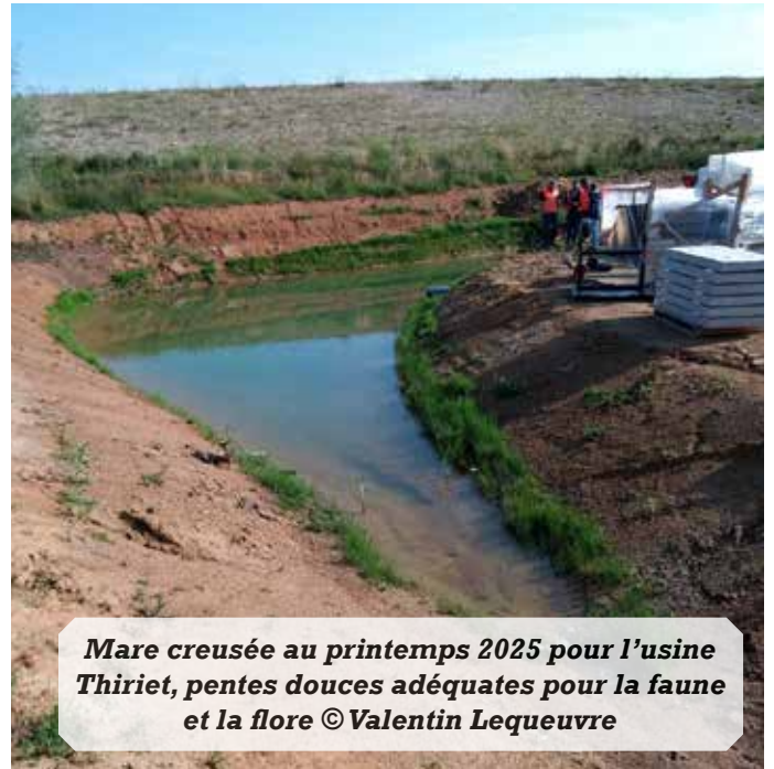
Mare creusée au printemps 2025 pour l'usine Thiriet, pentes douces adéquates pour la faune et la flore

Coté tribunal correctionnel, le recours du porteur de projet qui attaquait l'association pour recours abusif a été rejeté. Le demandeur a là aussi fait appel de cette décision.