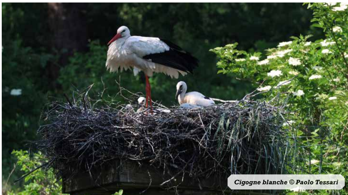
Cigogne blanche

Il a permis le recensement de 5 019 individus de 38 espèces différentes. Là aussi, cela concerne des « oiseaux d'eau » comme les canards de surface, les canards plongeurs, les oies, mais aussi les hérons, limicoles, grues, et autres foulques.