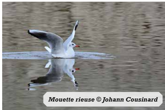
Mouette rieuse

En 2025, au moins 10 sites ont été occupés mais il n'a toutefois pas été possible de suivre les sites en fin de saison de reproduction. Le nombre de jeunes menés à l'envol demeure donc inconnu.