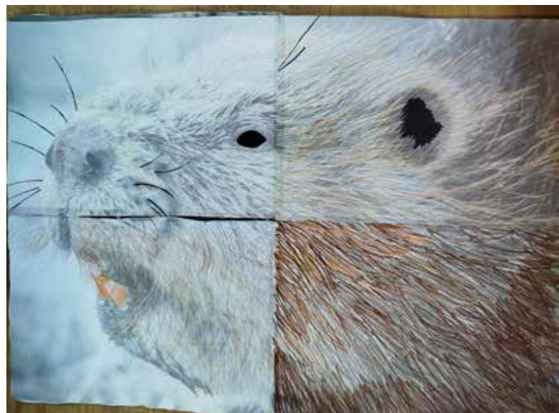
Biodiv' au quartier : travail artistique réalisé par les enfants du centre social Le Lac de Sedan

À l'issue de l'année, les élèves de 3 ème peuvent choisir une des thématiques abordées, la développer et la présenter lors d'un oral leur permettant de gagner des points pour le Brevet des collèges. Ainsi cette année, plusieurs élèves ont choisi d'aborder des thématiques telles que le Castor d'Europe, le retour du Loup ou le Sanglier.