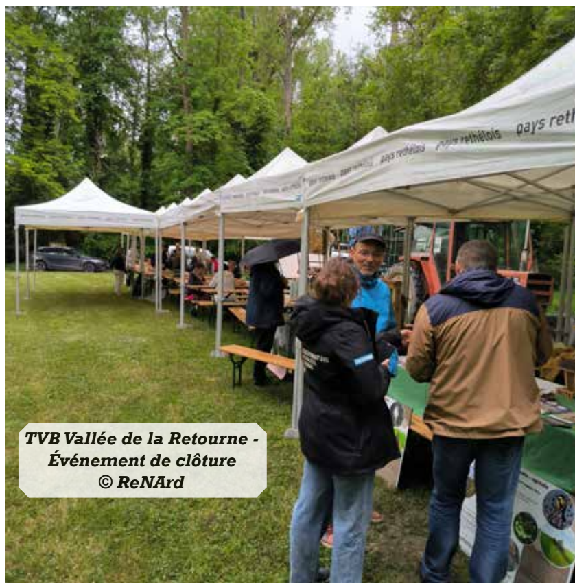
TVB Vallée de la Retourne - Événement de clôture

Comme pour tous les programmes TVB, nous remercions les partenaires Région Grand Est, DREAL Grand Est et les Agences de l'Eau pour leur soutien.