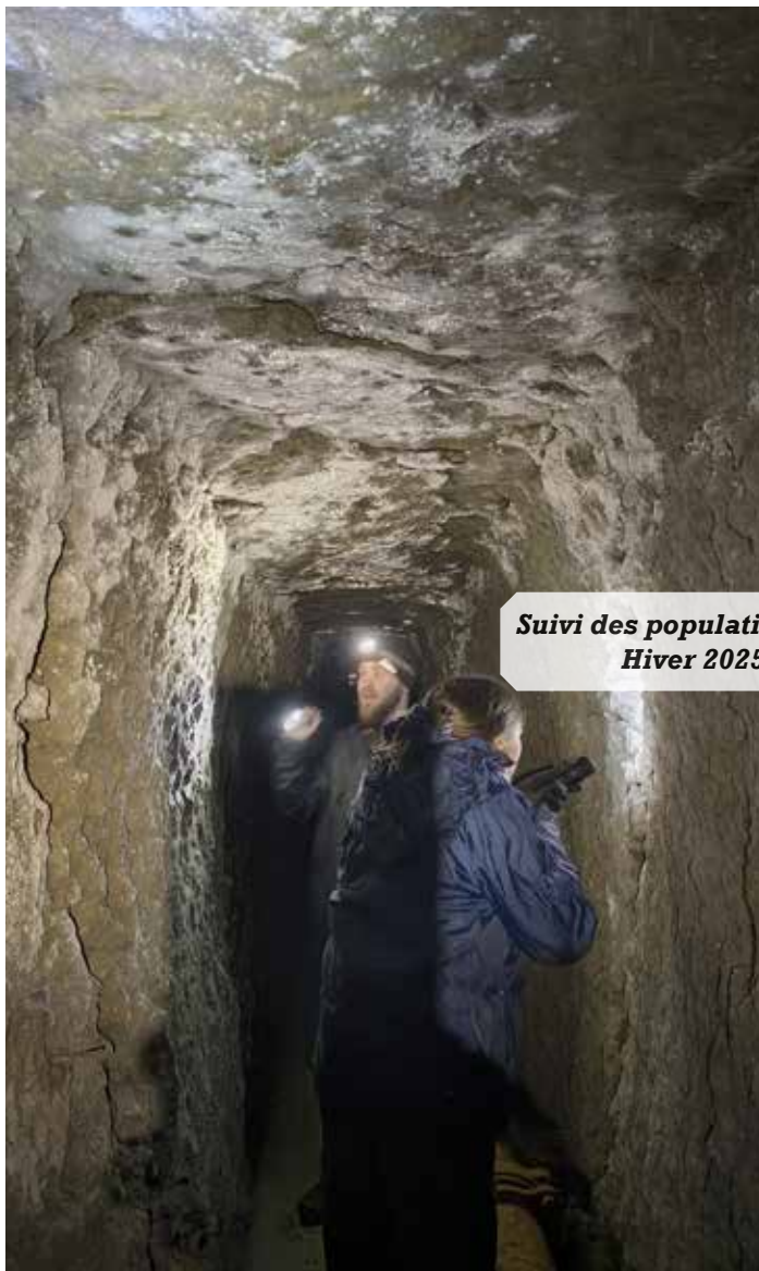
Suivi des populations de chiroptères Hiver 2025