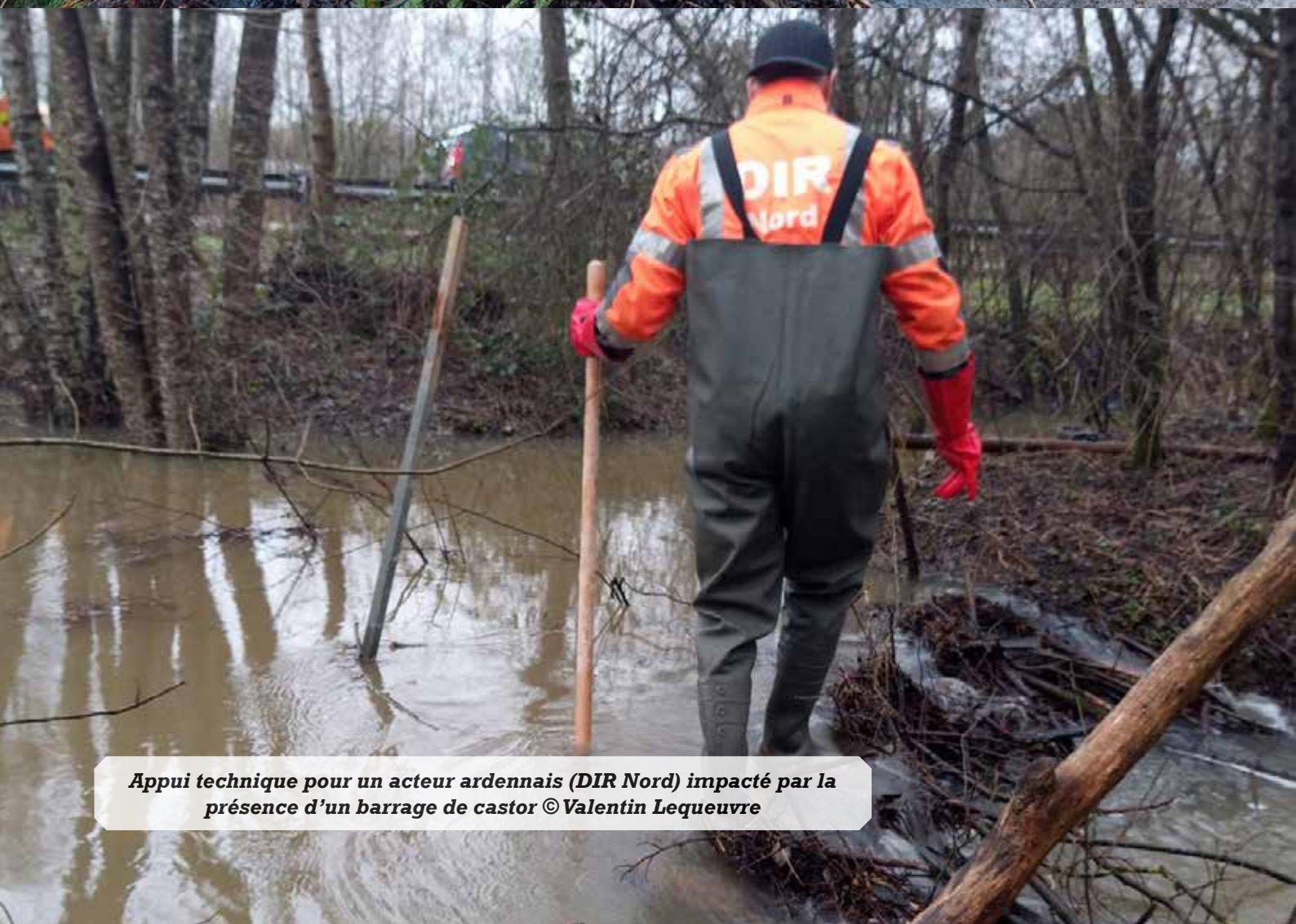
Appui technique pour un acteur ardennais (DIR Nord) impacté par la présence d'un barrage de castor