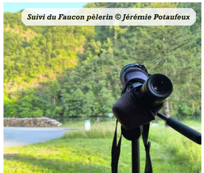
Suivi du Faucon pèlerin

Durant la saison 2025, 10 sites ont été occupés (dont 5 sur pylône électrique) et au moins 6 ont accueilli des poussins. La réussite des nichées n'a toutefois pas pu être suivie avec autant d'assiduité, mais on dénombre au minimum 13 jeunes menés à l'envol.