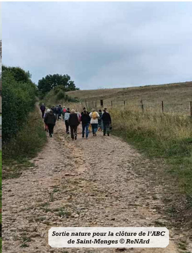
Sortie nature pour la clôture de l'ABC de Saint-Menges